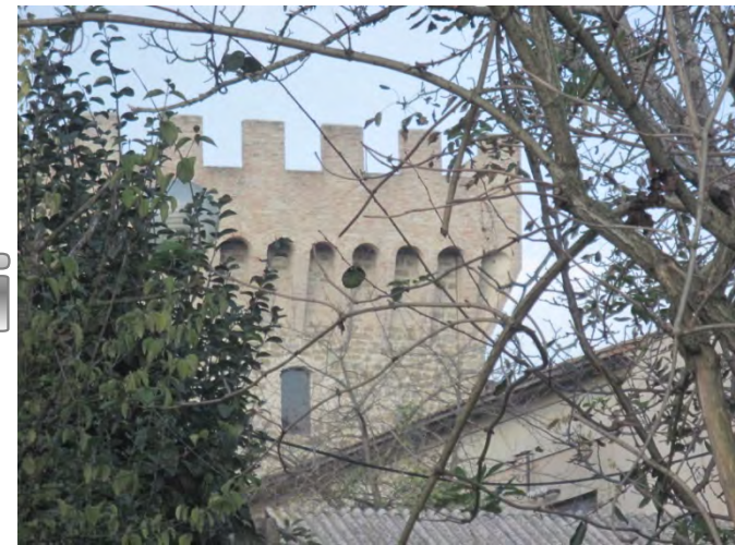
La torre a difesa del grano e del mulino